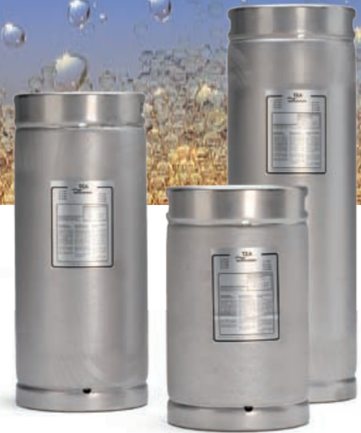
TKA Industrie-Ionenaustauscher-Patronen bis 3000 Liter/h

Komplett aus V4A Edelstahl. Druckfest bis 10 bar. Besonders wirtschaftlich bei einem Reinwasserbedarf von bis zu 150 l pro Tag.