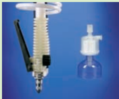
TKA Dispenser und Sterilfilter Zum Anschluss an druckfeste TKA Ionenaustauscher Patronen zur Herstellung von Aqua Purificata. • Dispenser ohne Wandhalter Nr. 03.1408 • Dispenser mit Wandhalterung Nr. 03.1409 • Sterilfilter für Dispenser, 0,2 \mu\text{m} Porengröße, Leistung 10 – 90 l/h Nr. 09.1003