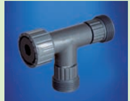
TKA Verteilerblock Aus Kunststoff. 1 Eingang, 2 Ausgänge mit Anschlussmöglichkeit für Absperr- und Verteilerhähne. Anschlüsse R 3/4" Nr. 03.1420