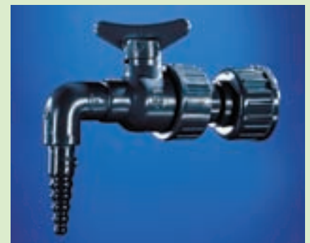
TKA Reinstwasserentnahmehahn Aus Kunststoff, winklig. Anschluss R 3/4", Überwurfmutter. Abmessungen: 50 x 90 x 140 mm. Nr. 03.1401